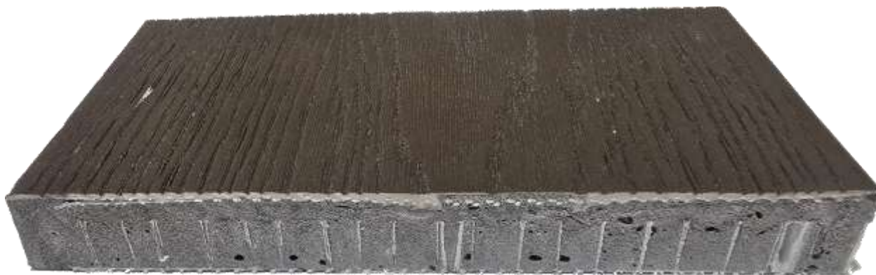
Рис. 1 фото образца (ДТ №1 22.09/25 ДТ.) Террасная доска из полиуретана PUDECK полнотелая 25x200x2440 мм»