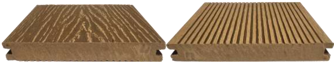
Рис. 1 фото образца (ДТ №4 22.09/25 пес.) Террасная доска из ДПК MASSIVE 3D WOOD 20x140x2900 мм»