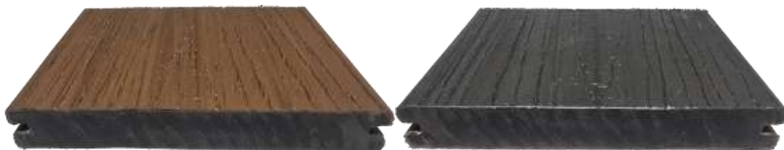
Рис. 1 фото образца (ДТ №2 22.09/25 G/S.) Террасная доска из ДПК МАССИВ со-extrusion 1.5 двухцветная 20x140x2900 мм»