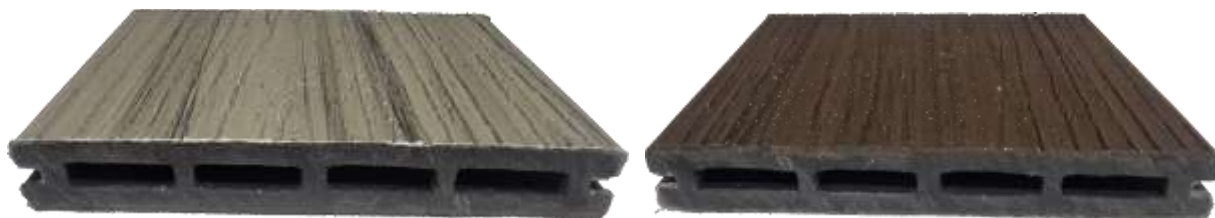
Рис. 1 фото образца (ДТ №3 22.09/25 С/С.) Террасная доска из ДПК co-extrusion 1.5 двухцветная 20x140x2900 мм»